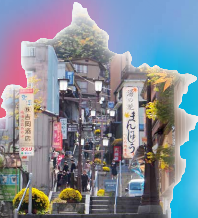
伊香保温泉 石段街